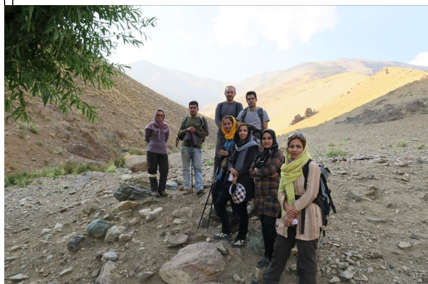
عکس دسته گروه دوم و تیم امداد