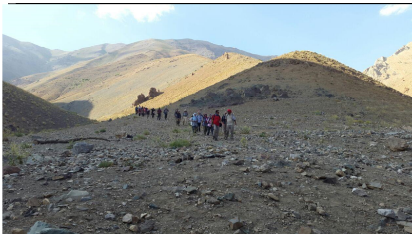
بازگشت گروه اول از قله به محل تقاطع دو رودخانه