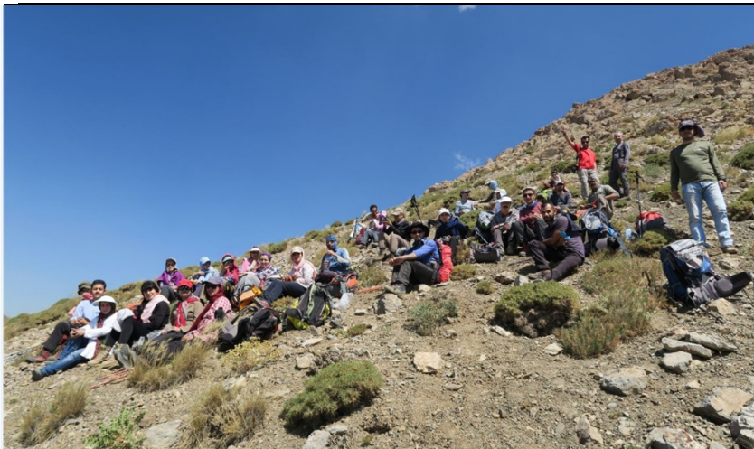
محل استراحت در یال جنوبی