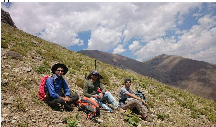
تیم امداد در مسیر برگشت ، ضلع شرقی قله