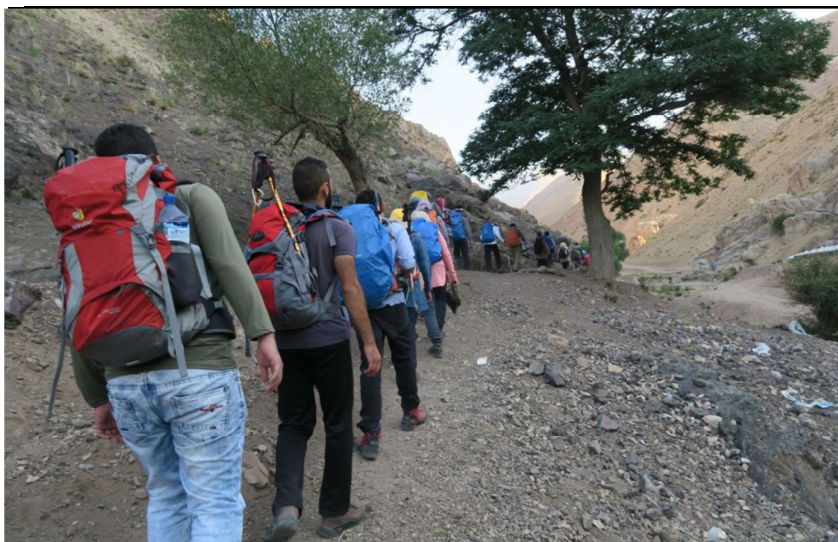
شروع حرکت از روستای جابان