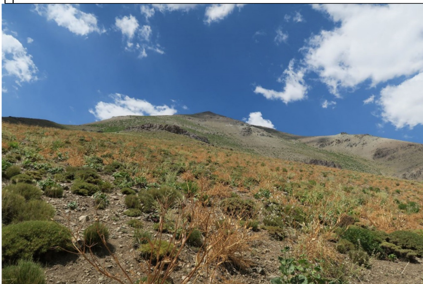
نمای قله از دره‌ی جنوبی